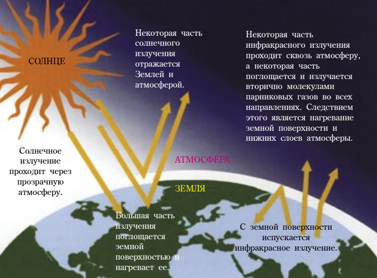
Рисунок 1. Парниковый эффект

ства состоят в основном из соединений углерода и водорода. При горении выделяется углекислый газ. Из-за этого каждый год человечество выбрасывает в атмосферу более 7 миллиардов тонн углекислого газа!